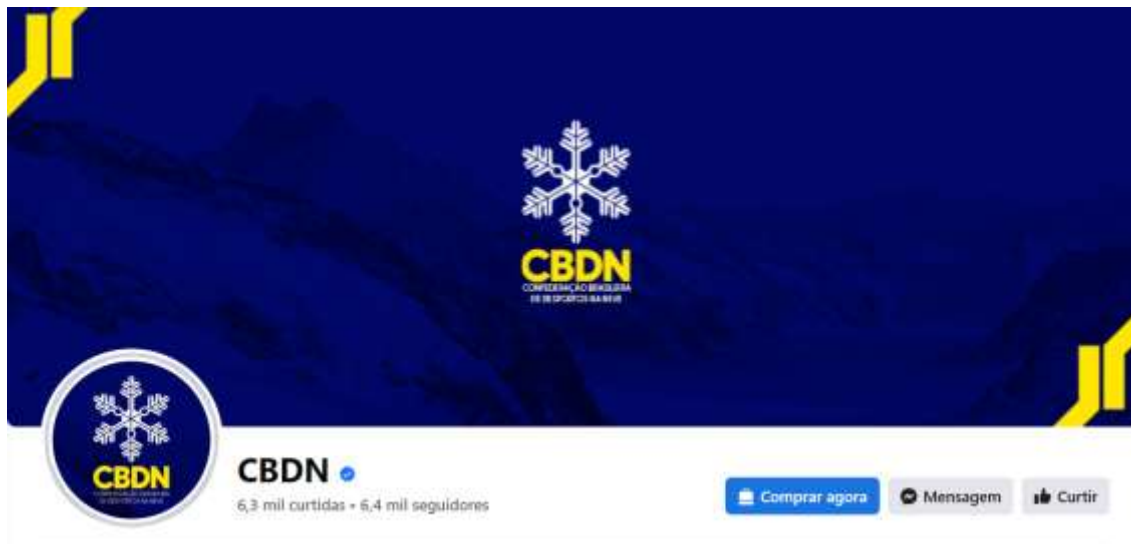
Figura 4. Reprodução da capa da fan page da CBDN no Facebook .

O Facebook é uma das principais ferramentas utilizadas na estratégia da Confederação, que mantém sua fan page desde 2010, e, atualmente, registra 6.316 fãs.