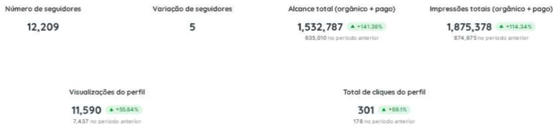
Figura 1. Números do Instagram acumulados durante a temporada boreal

Entre as publicações que mais repercutiram com o público, destacaram-se conteúdos relacionados aos feitos dos atletas brasileiros competindo na América do Norte e Europa. Com destaque especial para o título mundial de Aline Rocha no Para Ski Cross Country.