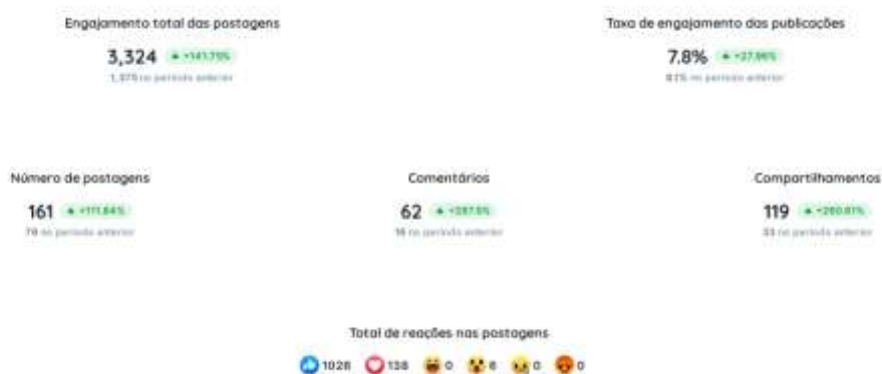
Figura 6. Dados da página do Facebook durante o período Boreal.

Os posts na página também acumularam curtidas, comentários e compartilhamentos que indicam o nível de engajamento dos fãs com os conteúdos postados. Durante a temporada, as postagens somaram 11.369 em engajamento total, reações, comentários, compartilhamentos e cliques.