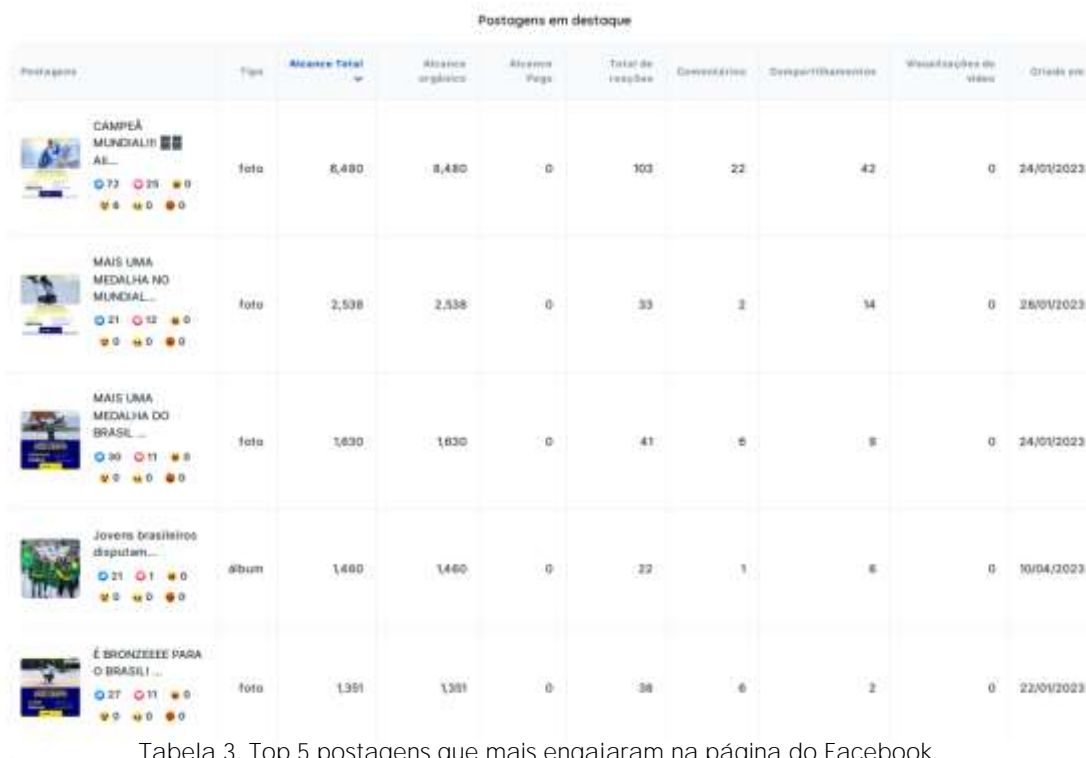
Tabela 3. Top 5 postagens que mais engajaram na página do Facebook.

Os posts na página também acumularam curtidas, comentários e compartilhamentos que indicam o nível de engajamento dos fãs com os conteúdos postados. Durante a temporada, as postagens somaram 11.369 em engajamento total, reações, comentários, compartilhamentos e cliques.