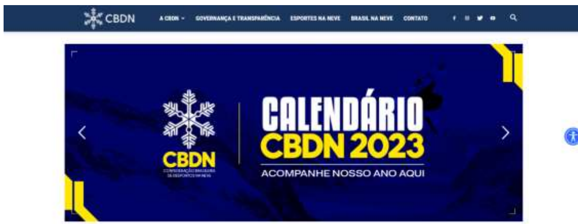
Figura 8. Reprodução da home page do site da CBDN.

Tanto no site da CBDN, como no Brasil na Neve, as postagens regulares sobre atletas brasileiros competindo no Hemisfério Norte aliado aos conteúdos de dicas e turismo na neve rendeu bons números para a Confederação no período Boreal da Temporada 2022/23.