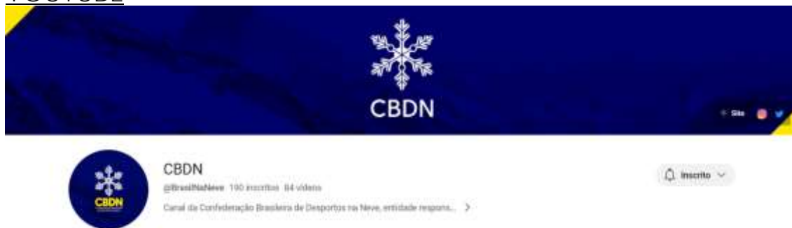
Figura 7. Reprodução do canal CBDNBrasil no YouTube.

No YouTube, o canal da Confederação contabiliza até hoje 39.304 visualizações. No período da temporada, o canal acumulou 34 novos inscritos e 135 novas curtidas.